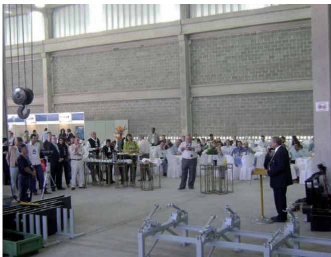
Ao todo 300 visitantes estiveram presentes em 05 junho a feira realizada pela WCH

No dia 05 Junho de 2008 a firma Weiler-C.Holzberger Industrial Ltda, situada em Rio Claro, próximo a São Paulo-Brasil, apresentou aos seus clientes e visitantes os mais novos produtos e desenvolvimentos. A exposição teve um público de aproximadamente 300 visitantes de todas as partes da América do Sul, foi também ao mesmo tempo a inauguração da ampliação da nave de produção, que a fábrica WCH vem ocupando desde então.