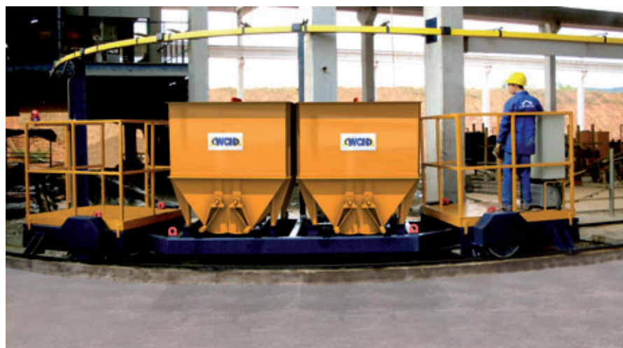
Carro Articulado para Transporte de Concreto WCH

Este sistema está em operação nas dependências da fábrica da Leonardi Construções, sendo utilizado diariamente na produção.